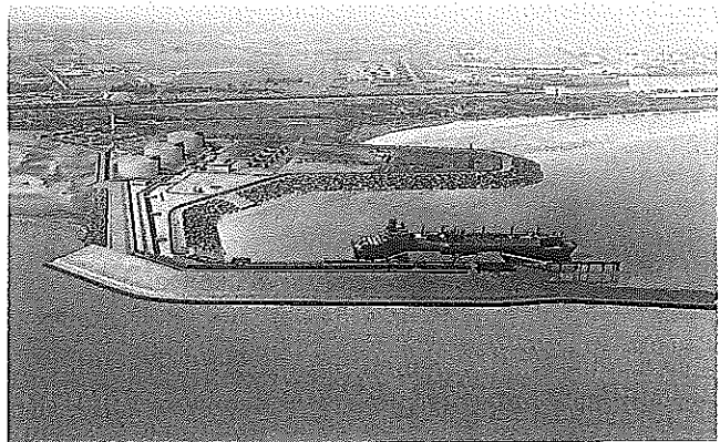
Las plantas como la desarrollada por Sener en Dunkerque serán necesarias en Colombia.

En el horizonte de 2020, el país también perderá la autosuficiencia en